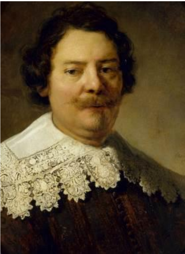
Rembrandt Harmensz. van Rijn (Werkstatt) Willem Burchgraeff (Detail), 1633 Gemäldegalerie Alte Meister, Staatliche Kunstsammlungen Dresden