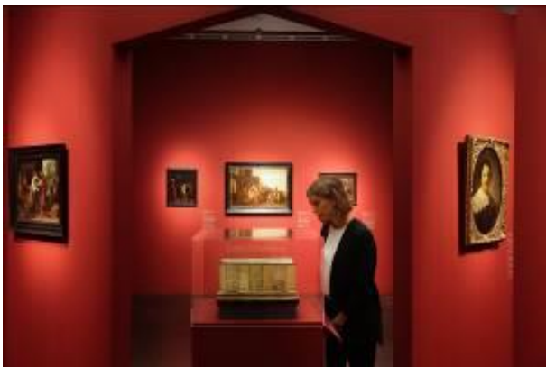
Ausstellungsansicht Bucerius Kunst Forum Die Geburt des Kunstmarktes Rembrandt, Ruisdael, van Goyen und die Künstler des Goldenen Zeitalters