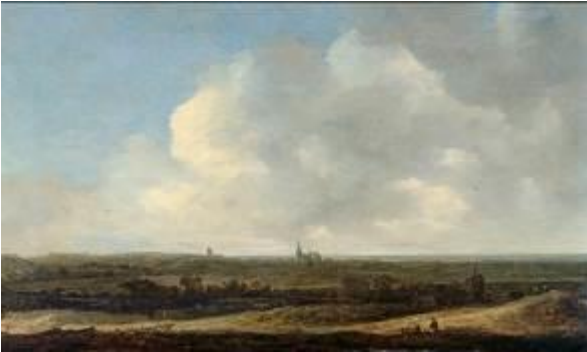
Jan Josephsz. van Goyen Flachlandschaft mit Blick auf Scheveningen, 1646 Museum der bildenden Künste, Leipzig

Das Bucerius Kunst Forum ist eine Einrichtung der ZEIT-Stiftung Ebelin und Gerd Bucerius