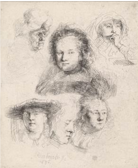
Rembrandt Harmenszoon van Rijn Sechs Kopfstudien: Saskia und eine unbekannte Person, 1636 Hamburger Kunsthalle, Kupferstichkabinett