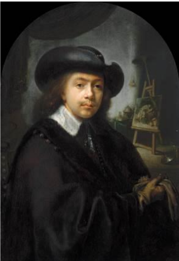
Gerrit Dou Selbstporträt, um 1645 The Kremer Collection – www.thekremercollection.com