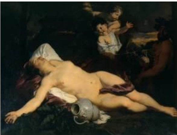
Gerard de Lairesse Schlafende Bacchantin, um 1680–1685 Kunsthalle Bremen – Der Kunstverein in Bremen