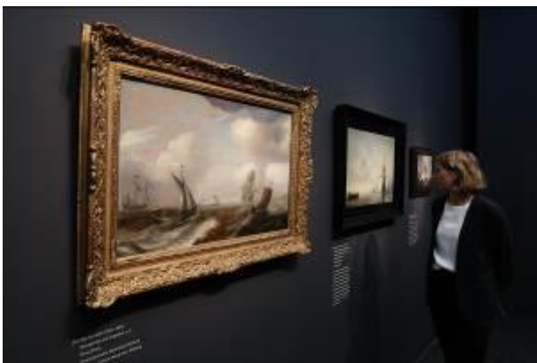
Ausstellungsansicht Bucerius Kunst Forum Die Geburt des Kunstmarktes Rembrandt, Ruisdael, van Goyen und die Künstler des Goldenen Zeitalters