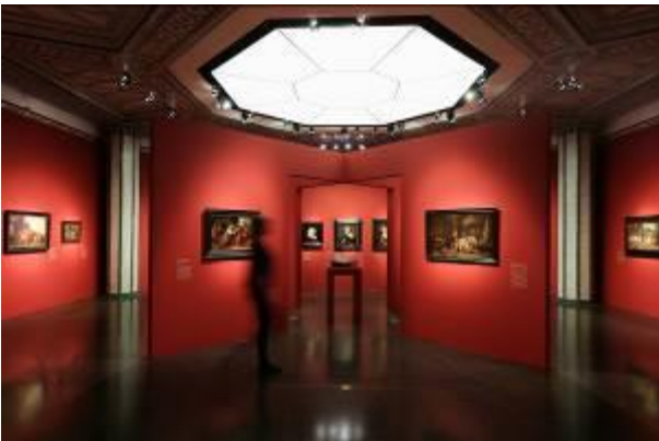
Ausstellungsansicht Bucerius Kunst Forum Die Geburt des Kunstmarktes Rembrandt, Ruisdael, van Goyen und die Künstler des Goldenen Zeitalters