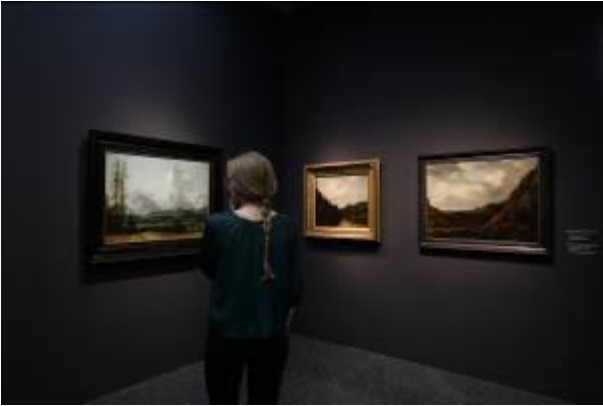
Ausstellungsansicht Bucerius Kunst Forum Die Geburt des Kunstmarktes Rembrandt, Ruisdael, van Goyen und die Künstler des Goldenen Zeitalters

Das Bucerius Kunst Forum ist eine Einrichtung der ZEIT-Stiftung Ebelin und Gerd Bucerius