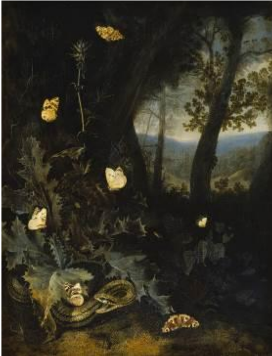
Otto Marseus van Schrieck Waldboden mit Distel und Schlange, o.J. Staatliches Museum Schwerin / Ludwigslust / Güstrow

Das Bucerius Kunst Forum ist eine Einrichtung der ZEIT-Stiftung Ebelin und Gerd Bucerius