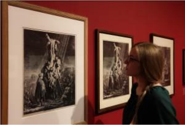
Ausstellungsansicht Bucerius Kunst Forum Die Geburt des Kunstmarktes Rembrandt, Ruisdael, van Goyen und die Künstler des Goldenen Zeitalters

Das Bucerius Kunst Forum ist eine Einrichtung der ZEIT-Stiftung Ebelin und Gerd Bucerius