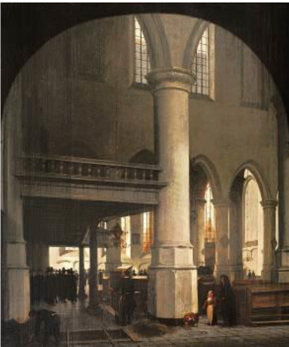
Hendrik van Vliet Innenansicht der Oude Kerk in Delft vom südlichen Seitenschiff, 1657 Privatsammlung