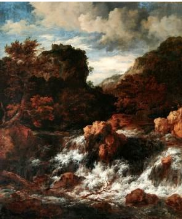
Jacob Isaaksz. van Ruisdael Wasserfall mit Bergschloss, o. J. Herzog Anton Ulrich-Museum, Braunschweig