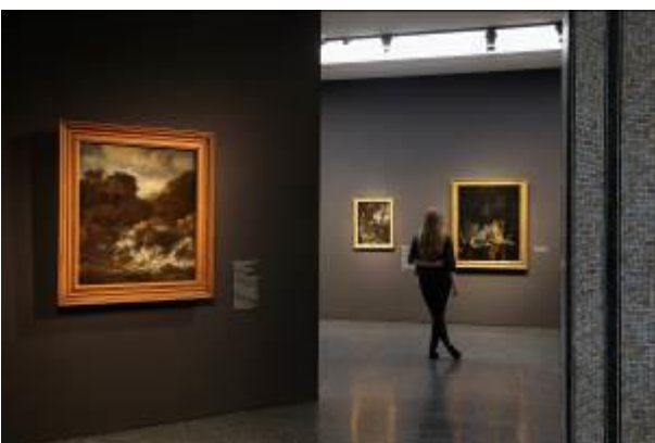
Ausstellungsansicht Bucerius Kunst Forum Die Geburt des Kunstmarktes Rembrandt, Ruisdael, van Goyen und die Künstler des Goldenen Zeitalters