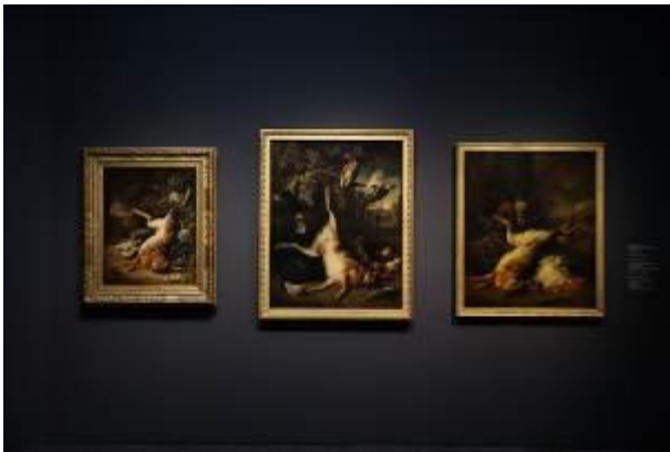
Ausstellungsansicht Bucerius Kunst Forum Die Geburt des Kunstmarktes Rembrandt, Ruisdael, van Goyen und die Künstler des Goldenen Zeitalters