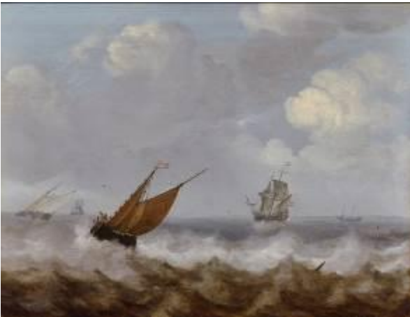
Julius Porcellis Schiffe auf stürmischer See, o. J. Staatliches Museum Schwerin / Ludwigslust / Güstrow