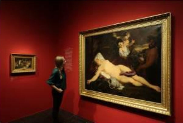
Ausstellungsansicht Bucerius Kunst Forum Die Geburt des Kunstmarktes Rembrandt, Ruisdael, van Goyen und die Künstler des Goldenen Zeitalters

Das Bucerius Kunst Forum ist eine Einrichtung der ZEIT-Stiftung Ebelin und Gerd Bucerius