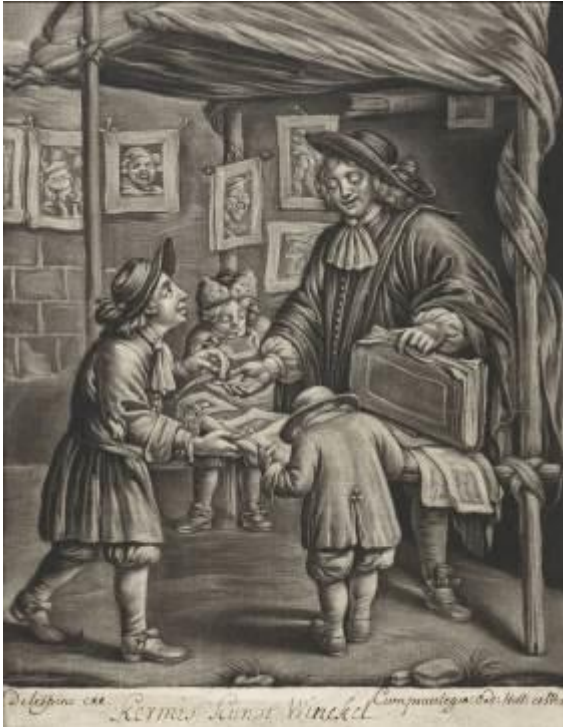
Jan van Somer Kunstladen auf der Kirmes, 1675–1696 Rijksmuseum, Amsterdam

Das Bucerius Kunst Forum ist eine Einrichtung der ZEIT-Stiftung Ebelin und Gerd Bucerius