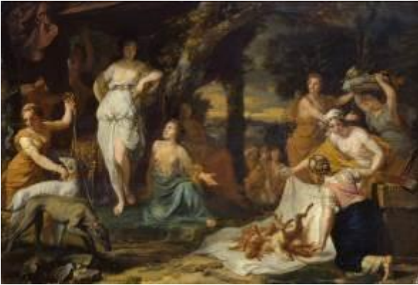
Gerard de Lairesse Jagdbeute der Diana, um 1670 Staatliches Museum Schwerin / Ludwigslust / Güstrow

Das Bucerius Kunst Forum ist eine Einrichtung der ZEIT-Stiftung Ebelin und Gerd Bucerius