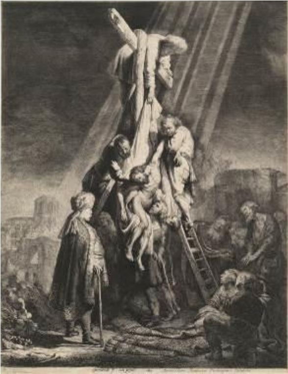
Rembrandt Harmensz. van Rijn Kreuzabnahme, um 1632 Hamburger Kunsthalle, Kupferstichkabinett

Das Bucerius Kunst Forum ist eine Einrichtung der ZEIT-Stiftung Ebelin und Gerd Bucerius