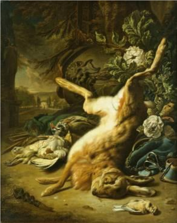
Jan Weenix Jagdstillleben mit erlegtem Hasen, o. J. Hamburger Kunsthalle