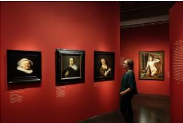
Ausstellungsansicht Bucerius Kunst Forum Die Geburt des Kunstmarktes Rembrandt, Ruisdael, van Goyen und die Künstler des Goldenen Zeitalters