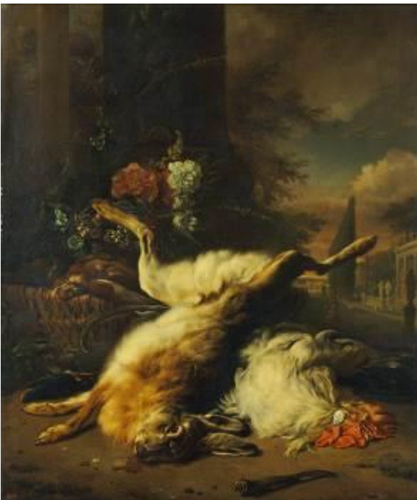
Jan Weenix Stilleben mit totem Hasen und Geflügel, 1701 Museumslandschaft Hessen Kassel, Gemäldegalerie Alte Meister