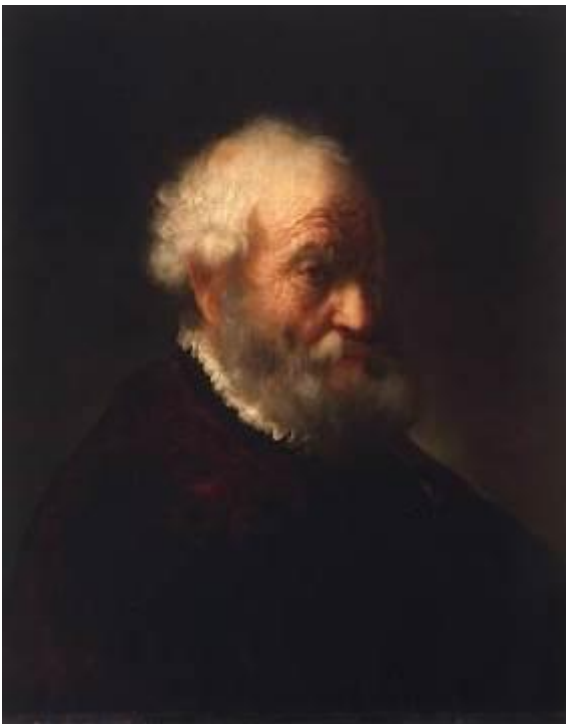
Govert Flinck Brustbild eines bärtigen alten Mannes, um 1638–1640 Galerie Hans, Hamburg