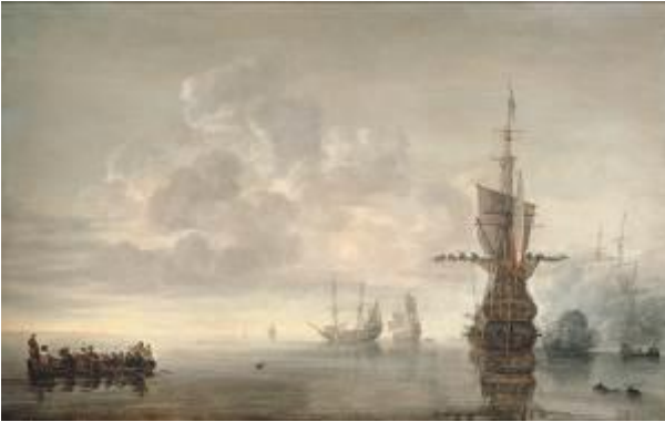
Simon Jacobsz de Vlieger Das Flaggschiff Aemilia feuert Salut für Admiral Maerten Harpertsz. Tromp, 1640er Jahre Privatsammlung

Das Bucerius Kunst Forum ist eine Einrichtung der ZEIT-Stiftung Ebelin und Gerd Bucerius