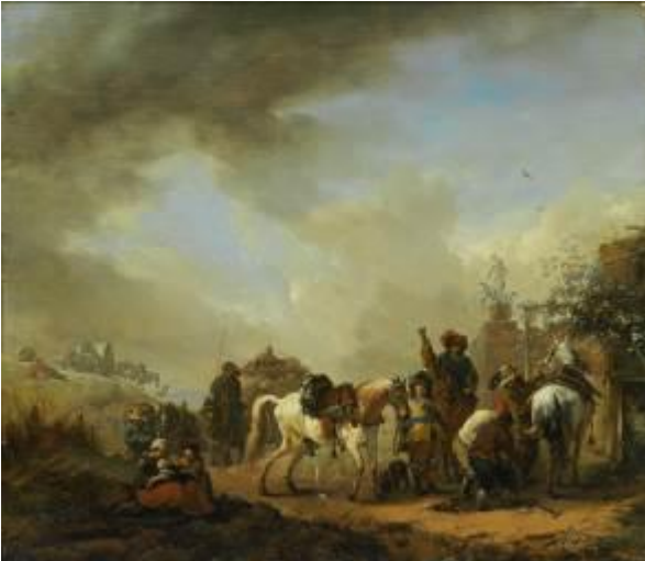
Philips Wouwerman Der Schimmel vor der Schmiede, nach 1654 Museumslandschaft Hessen Kassel, Gemäldegalerie Alte Meister

Das Bucerius Kunst Forum ist eine Einrichtung der ZEIT-Stiftung Ebelin und Gerd Bucerius