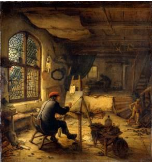
Adriaen van Ostade Der Maler in seiner Werkstatt, 1663 Gemäldegalerie Alte Meister, Staatliche Kunstsammlungen Dresden