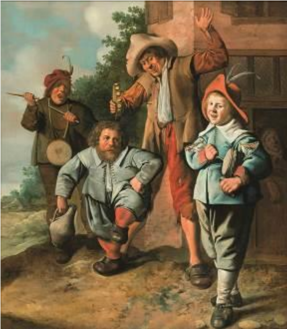
Jan Miense Molenaer Jugendliche Musikanten und ein tanzender Zwerg, um 1630–1635 SØR Rusche Sammlung Oelde / Berlin

Das Bucerius Kunst Forum ist eine Einrichtung der ZEIT-Stiftung Ebelin und Gerd Bucerius