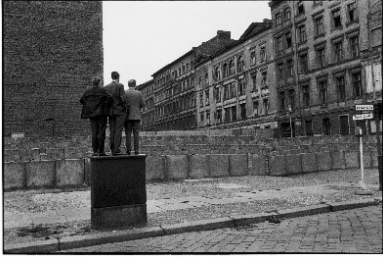
Henri Cartier-Bresson: Berliner Mauer, Westdeutschland, 1962, © 2024 Fondation Henri Cartier-Bresson / Magnum Photos