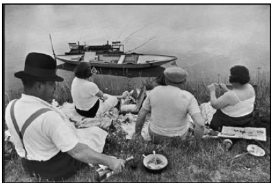
Henri Cartier-Bresson: Erster bezahlter Urlaub, Ufer der Seine bei Juvisy-sur-Orge, Frankreich, 1938, © 2024 Fondation Henri Cartier-Bresson / Magnum Photos