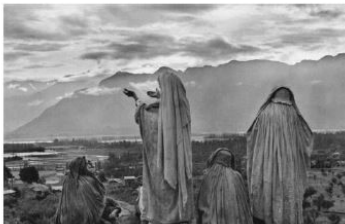
Henri Cartier-Bresson: Srinagar, Kaschmir, Indien, 1948 , © 2024 Fondation Henri Cartier-Bresson / Magnum Photos