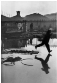
Henri Cartier-Bresson: Hinter dem Gare Saint-Lazare , 1932, © 2024 Fondation Henri Cartier-Bresson / Magnum Photos