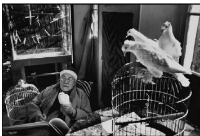
Henri Cartier-Bresson: Henri Matisse zu Hause, Vence, Frankreich, 1944 , © 2024 Fondation Henri Cartier-Bresson / Magnum Photos