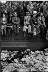
Henri Cartier-Bresson: Krönung Königs George VI, London, Großbritannien, 12. Mai 1937, © 2024 Fondation Henri Cartier-Bresson / Magnum Photos