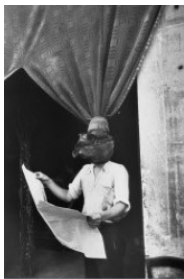
Henri Cartier-Bresson: Livorno, Italien , 1933, © 2024 Fondation Henri Cartier-Bresson / Magnum Photos