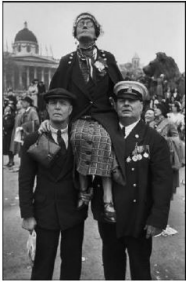
Henri Cartier-Bresson: Krönung Königs George VI, London, Großbritannien, 12. Mai 1937, © 2024 Fondation Henri Cartier-Bresson / Magnum Photos