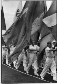
Henri Cartier-Bresson: Dynamo-Stadion, Moskau, Russland, Juli 1954 , © 2024 Fondation Henri Cartier-Bresson / Magnum Photos