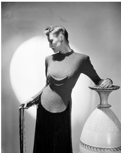
Lee Miller: The Lead evening dress , London, 1941 © Lee Miller Archives England 2022