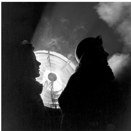
Lee Miller, Auxiliary Territorial Service searchlight operators, Nord-London, 1943