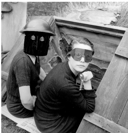
Lee Miller: Fire masks , London, 1941 © Lee Miller Archives England 2022