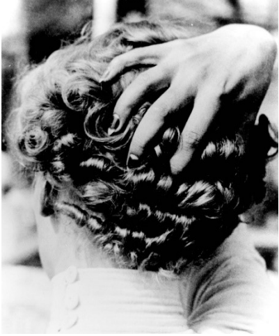
Lee Miller, Untitled [woman with hand on head], Paris, 1931