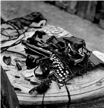
Lee Miller, Remington Silent, London, 1940