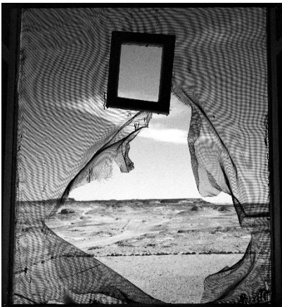
Lee Miller, Portrait of space , Ägypten, 1937