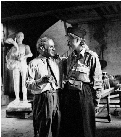
Lee Miller, Picasso and Lee Miller in his studio, Paris, 1944