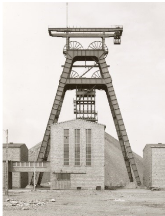
Bernd und Hilla Becher: Förderturm, Fosse Nœux no. 13, Frankreich, 1972