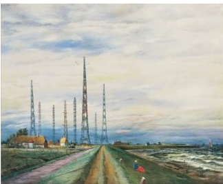
Franz Radziwill: Der Sender Norddeich , 1933, Museum für Kommunikation Frankfurt © VG Bild-Kunst, Bonn 2021