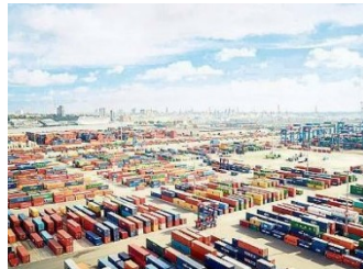
Henrik Spohler: Containerterminal , Hamburg 2013, Deutschland © Henrik Spohler