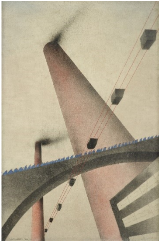
Oskar Nerlinger: An die Arbeit , 1930, Kulturstiftung Sachsen-Anhalt, Kunstmuseum Moritzburg Halle (Saale) © S. Nerlinger