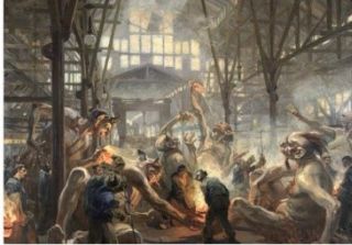
Heinrich Kley: Die Krupp'schen Teufel , um 1912/13, LWL-Industriemuseum - Westfälisches Landesmuseum für Industriekultur