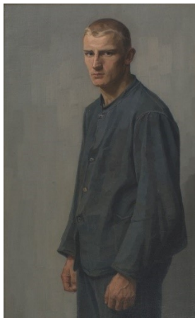
Georg Friedrich Zundel: Bildnis eines Schlossers, 1901, Privatsammlung © Nachlass Georg Friedrich Zundel