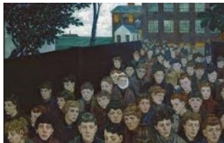
Hans Baluschek: Arbeiterinnen, 1900