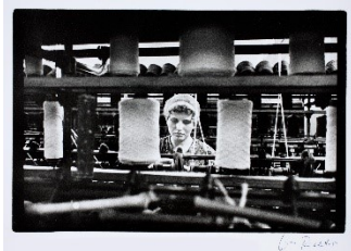
Evelyn Richter: Kammgarnspinnerei , Leipzig 1970, Münchner Stadtmuseum © VG Bild-Kunst, Bonn 2021