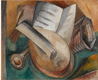
Georges Braque: Les instruments de musique / Die Musikinstrumente , Herbst 1908, Centre Pompidou, Musée national d'art moderne, Paris © VG Bild-Kunst, Bonn 2021 © Foto: Centre Pompidou, MNAM-CCI / Georges Meguerditchian / Dist. RMN-GP