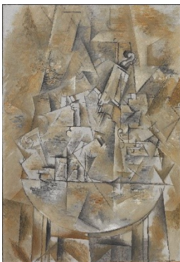
Georges Braque: Le Guéridon / Der Guerdion , Herbst 1911, Centre Pompidou, Musée national d'art moderne, Paris Schenkung Raoul La Roche, 1953 © VG Bild-Kunst, Bonn 2021 © Foto: Centre Pompidou, MNAM-CCI / Philippe Migeat / Dist. RMN-GP