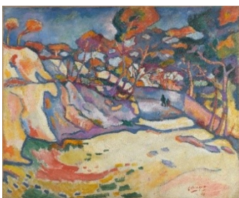
Georges Braque: L'Estaque , Oktober/November 1906, Centre Pompidou, Musée national d'art moderne, Paris © VG Bild-Kunst, Bonn 2021