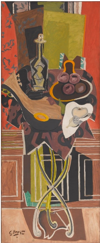
Georges Braque: Le Guéridon rouge / Das rote Tischchen, 1939-1952, Centre Pompidou, Musée national d'art moderne, Paris Schenkung Madame Georges Braque, 1965