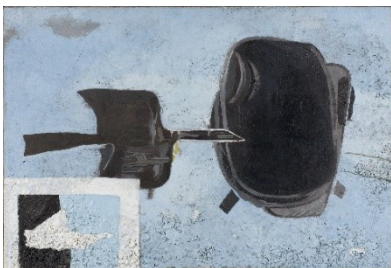
Georges Braque: À tire d'aile / Mit raschem Flügelschlag, 1956-1961, Centre Pompidou, Musée national d'art moderne, Paris Schenkung Madame Georges Braque, 1965