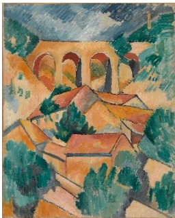
Georges Braque: Le Viaduc de L'Estaque / Der Viadukt von L'Estaque , Anfang 1908, Centre Pompidou, Musée national d'art moderne, Paris © VG Bild-Kunst, Bonn 2021