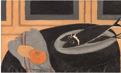
Georges Braque: Les Poissons noirs / Schwarze Fische (Detail), 1942, Collection Centre Pompidou, Musée national d'art moderne, Paris Schenkung des Künstlers, 1947 © VG Bild-Kunst, Bonn 2021