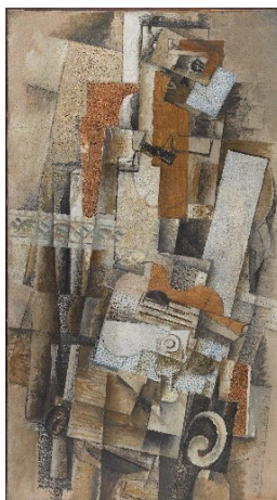
Georges Braque: L'homme à la guitare / Mann mit Gitarre , Frühjahr 1914, Centre Pompidou, Musée national d'art moderne, Paris Erworben dank eines Sonderkredits des französischen Staates mit der Unterstützung der Scaler Foundation, 1981 © VG Bild-Kunst, Bonn 2021 © Foto: Centre Pompidou, MNAM-CCI / Philippe Migeat / Dist. RMN-GP