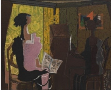
Georges Braque: Le duo / Das Duo , Anfang 1937, Centre Pompidou, Musée national d'art moderne, Paris © VG Bild-Kunst, Bonn 2021