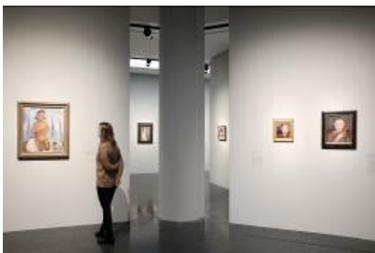
Blick in die Ausstellung Paula Modersohn Becker. Der Weg in die Moderne im Bucerius Kunst Forum, 2017