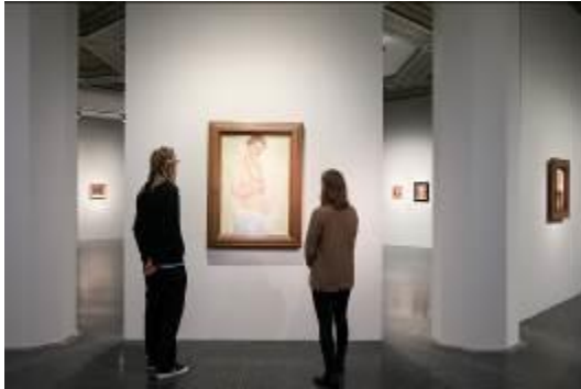
Blick in die Ausstellung Paula Modersohn Becker. Der Weg in die Moderne im Bucerius Kunst Forum, 2017