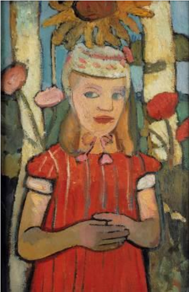
Paula Modersohn-Becker Mädchen in rotem Kleid vor Sonnenblume , 1907 Privatbesitz