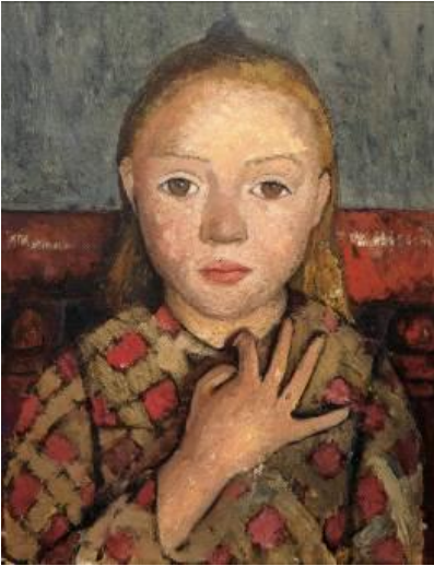
Paula Modersohn-Becker Mädchenbildnis mit gespreizter Hand vor der Brust, um 1905 Von der Heydt-Museum, Wuppertal