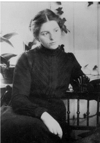
Portrait der Künstlerin Paula Modersohn-Becker in der Veranda ihres Hauses, 1901