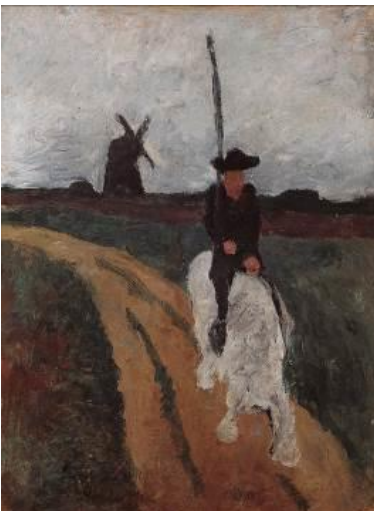
Paula Modersohn-Becker Don Quichote , 1900 Paula-Modersohn-Becker-Stiftung, Bremen