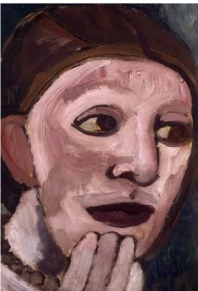
Paula Modersohn-Becker Selbstbildnis nach halbrechts, die Hand am Kinn , 1906 Privatbesitz