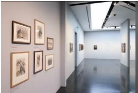
Blick in die Ausstellung Paula Modersohn Becker. Der Weg in die Moderne im Bucerius Kunst Forum, 2017