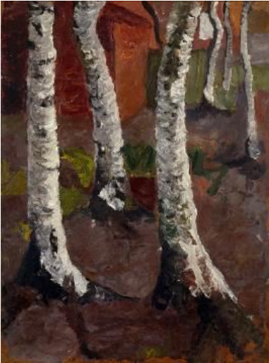
Paula Modersohn-Becker Birkenstämme , um 1901 Paula-Modersohn-Becker-Stiftung, Bremen