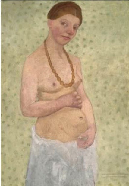
Paula Modersohn-Becker Selbstbildnis am 6. Hochzeitstag , 1906 Museen Böttcherstraße, Paula Modersohn-Becker Museum, Bremen