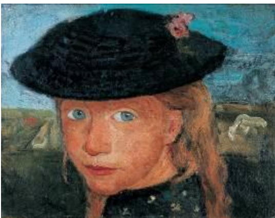
Paula Modersohn-Becker Kopf eines blonden Mädchens mit Strohhut , um 1904 Kunst- und Museumsverein Wuppertal