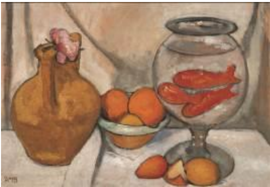
Paula Modersohn-Becker Stilleben mit Goldfischglas , 1906 Von der Heydt-Museum, Wuppertal