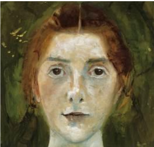
Paula Modersohn-Becker Selbstbildnis, frontal , 1897 Paula-Modersohn-Becker-Stiftung, Bremen