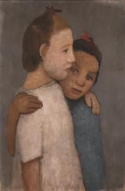
Paula Modersohn-Becker Zwei Mädchen in weißem und blauem Kleid, sich an der Schulter umfassend , 1906 Privatbesitz