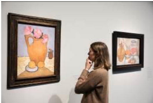
Blick in die Ausstellung Paula Modersohn Becker. Der Weg in die Moderne im Bucerius Kunst Forum, 2017