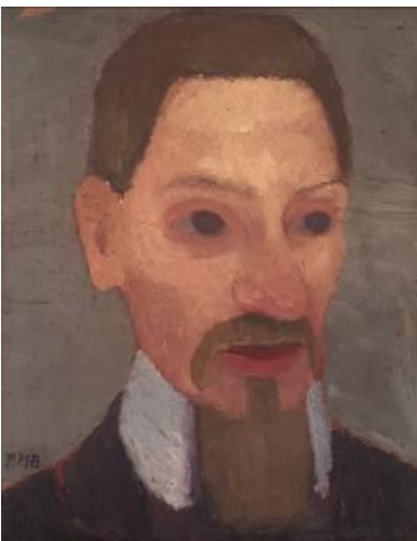
Paula Modersohn-Becker Bildnis Rainer Maria Rilke , 1906 Paula-Modersohn-Becker-Stiftung, Bremen Leihgabe aus Privatbesitz