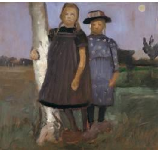
Paula Modersohn-Becker Zwei Mädchen an einem Birkenstamm stehend, um 1902 Museen Böttcherstraße, Paula Modersohn-Becker Museum, Bremen, Dauerleihgabe aus Privatbesitz