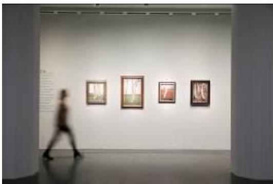
Blick in die Ausstellung Paula Modersohn Becker. Der Weg in die Moderne im Bucerius Kunst Forum, 2017